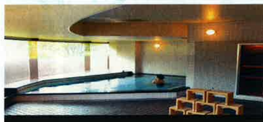
沸かし湯(温泉ではありません)...サウナ付