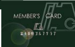
現在のチェックインカード