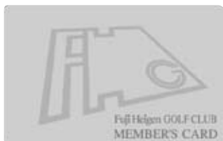
新デザインの チェックインカード

会員様のポイントカードは発行せず、会員カード(チェックインカード)によりポイント管理をいたします。従って会員カード(チェックインカード)をお持ちの会員様のみポイント付与となります。ポイントをご希望の会員様で、現在チェックインカードをお持ちでない会員様はフロントにチェックインカードのお申込みをお願いいたします(無料)