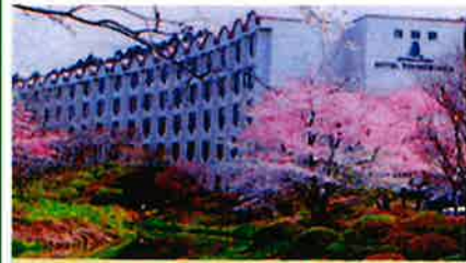
ホテル 時之栖 ときのすみか