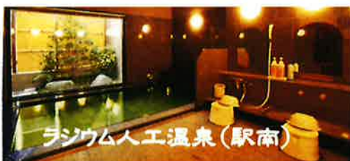
ラグジュアリー人工温泉(駅南)