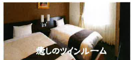
癒しのツインルーム