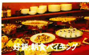
好評朝食バイキング